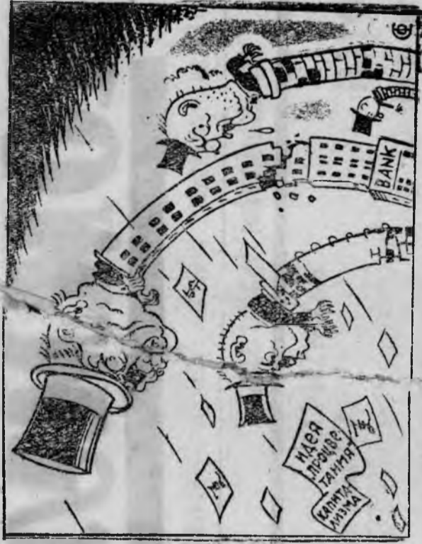
Рис. В. Васильева.

17 конференция ВКП(б) считает, что огромные природные богатства, страны, богатейшие темпы социалистического строительства, рас-